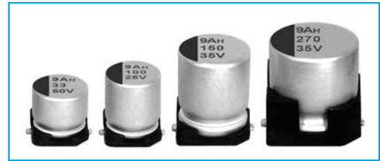
Marking color : Blue print