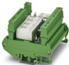
Customer-specific relay module, with plug-in bases for five miniature switching relays

Please be informed that the data shown in this PDF Document is generated from our Online Catalog. Please find the complete data in the user's documentation. Our General Terms of Use for Downloads are valid ( http://phoenixcontact.com/download )