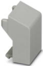
Filler plugs, for unoccupied terminal points

Please be informed that the data shown in this PDF Document is generated from our Online Catalog. Please find the complete data in the user's documentation. Our General Terms of Use for Downloads are valid ( http://phoenixcontact.com/download )