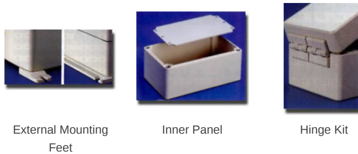
External Mounting Feet