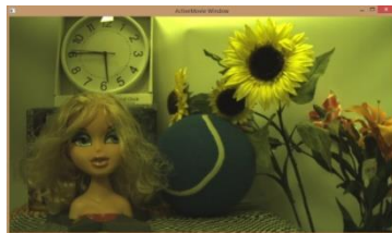
Camera Tool view mode