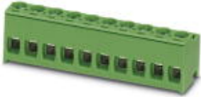
The figure shows a 10-position version of the product

PCB connector, number of positions: 16, pitch: 5 mm, connection method: Screw connection with tension sleeve, color: green, contact surface: Tin