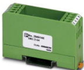
Custom circuit module, consisting of housing, MKDS 3 connection terminal blocks and PCB

Please be informed that the data shown in this PDF Document is generated from our Online Catalog. Please find the complete data in the user's documentation. Our General Terms of Use for Downloads are valid ( http://phoenixcontact.com/download )