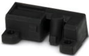
Holder for marking element

Please be informed that the data shown in this PDF Document is generated from our Online Catalog. Please find the complete data in the user's documentation. Our General Terms of Use for Downloads are valid ( http://phoenixcontact.com/download )