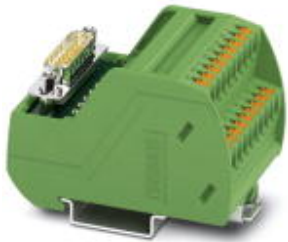
The illustration shows a 15-position version

Please be informed that the data shown in this PDF Document is generated from our Online Catalog. Please find the complete data in the user's documentation. Our General Terms of Use for Downloads are valid ( http://download.phoenixcontact.com )