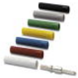
Insulating sleeve, Color: gray