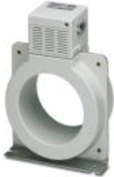
Residual current converter for type B+ residual current monitor.

Please be informed that the data shown in this PDF Document is generated from our Online Catalog. Please find the complete data in the user's documentation. Our General Terms of Use for Downloads are valid ( http://phoenixcontact.com/download )