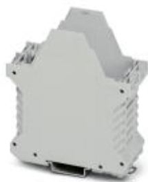
Component housing, length: 99 mm, Lower part, color: light gray

Please be informed that the data shown in this PDF Document is generated from our Online Catalog. Please find the complete data in the user's documentation. Our General Terms of Use for Downloads are valid ( http://phoenixcontact.com/download )