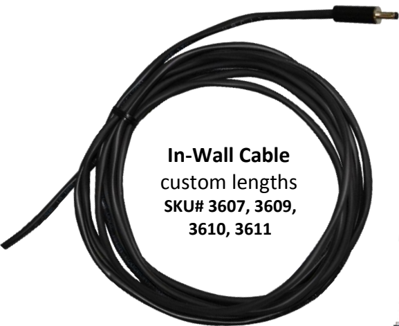
In-Wall Cable custom lengths SKU# 3607, 3609, 3610, 3611

Inspired LED's unique line of Interconnect Accessories are compatible with 3.5mm x 1.3mm DC input/output jacks. Cables are available in standard or custom lengths, and all interconnect products combine easily with Inspired LED flex strips and LED panels to create the perfect low-voltage lighting system for any location.