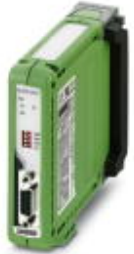
PROFIBUS DP interface/repeater module with oscilloscope functionality

Please be informed that the data shown in this PDF Document is generated from our Online Catalog. Please find the complete data in the user's documentation. Our General Terms of Use for Downloads are valid ( http://phoenixcontact.com/download )