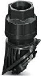
EVO plastic cable gland with bayonet locking; size M40, with filler plug

Please be informed that the data shown in this PDF Document is generated from our Online Catalog. Please find the complete data in the user's documentation. Our General Terms of Use for Downloads are valid ( http://phoenixcontact.com/download )