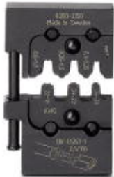
Die, for Crimpfox-M, for non-insulated slip-on sleeves 0.1 - 1 mm 2 , packed in a serial storage box

Please be informed that the data shown in this PDF Document is generated from our Online Catalog. Please find the complete data in the user's documentation. Our General Terms of Use for Downloads are valid ( http://download.phoenixcontact.com )