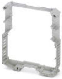
Complete housing, length: 99 mm, Central part, color: light gray, width: 17.5 mm

Please be informed that the data shown in this PDF Document is generated from our Online Catalog. Please find the complete data in the user's documentation. Our General Terms of Use for Downloads are valid ( http://phoenixcontact.com/download )