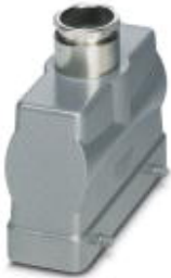
HEAVYCON B24 sleeve housing, for double locking latch, height: 76 mm, with 1 x M32 screw connection, straight cable outlet

Please be informed that the data shown in this PDF Document is generated from our Online Catalog. Please find the complete data in the user's documentation. Our General Terms of Use for Downloads are valid ( http://phoenixcontact.com/download )