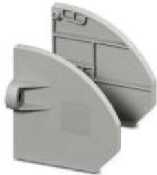
Flange cover, Color: gray

Please be informed that the data shown in this PDF Document is generated from our Online Catalog. Please find the complete data in the user's documentation. Our General Terms of Use for Downloads are valid ( http://phoenixcontact.com/download )