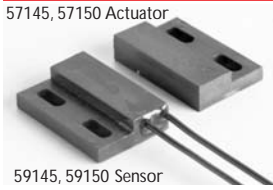
59145, 59150 Sensor