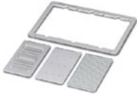
Magazine insert, for CMS-WMU, accepts: 3 PABA marker bars

Please be informed that the data shown in this PDF Document is generated from our Online Catalog. Please find the complete data in the user's documentation. Our General Terms of Use for Downloads are valid ( http://phoenixcontact.com/download )