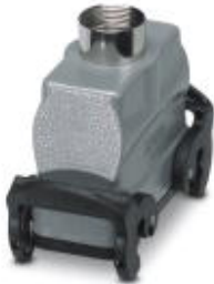
HEAVYCON B16 coupling housing, with double locking latch, height: 82 mm, with 1 x Pg21 gland, straight cable outlet

Please be informed that the data shown in this PDF Document is generated from our Online Catalog. Please find the complete data in the user's documentation. Our General Terms of Use for Downloads are valid ( http://download.phoenixcontact.com )