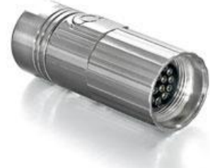
Contact Arrangement mating view

A ST A 876 NN 00 85 200A 000 A S A 876 N 00 85 200A 000