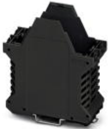
Component housing, Lower part, color: black

Please be informed that the data shown in this PDF Document is generated from our Online Catalog. Please find the complete data in the user's documentation. Our General Terms of Use for Downloads are valid ( http://phoenixcontact.com/download )