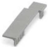
Terminal cover, 1 strip covers up to 12 terminal points, for ME-BUS terminal opening, (male side)

Electronic housing - ME B-KA KMGY - 2706302