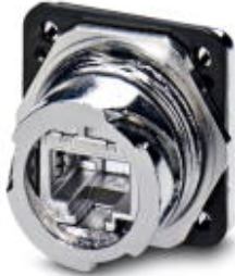
RJ45 mounting frame, IP67, for bayonet interlocking, metal, with socket-socket contact insert, for round mounting cutout, with seal, without mounting screws

Please be informed that the data shown in this PDF Document is generated from our Online Catalog. Please find the complete data in the user's documentation. Our General Terms of Use for Downloads are valid ( http://download.phoenixcontact.com )