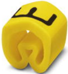
Conductor marking collar, labeled with the capital letter: Letters, yellow, width: 3.2 mm

Please be informed that the data shown in this PDF Document is generated from our Online Catalog. Please find the complete data in the user's documentation. Our General Terms of Use for Downloads are valid ( http://phoenixcontact.com/download )