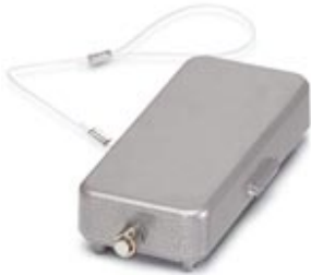
HEAVYCON protective cover, type B16, for supporting base element with single locking latch, with retaining cord, IP65, ALU

Please be informed that the data shown in this PDF Document is generated from our Online Catalog. Please find the complete data in the user's documentation. Our General Terms of Use for Downloads are valid ( http://download.phoenixcontact.com )