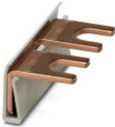
Wiring bridge for modules with connecting pitch 17.5 mm, 1-phase, 2-pos.

Please be informed that the data shown in this PDF Document is generated from our Online Catalog. Please find the complete data in the user's documentation. Our General Terms of Use for Downloads are valid ( http://download.phoenixcontact.com )