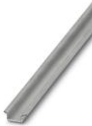
DIN rail, material: Steel, unperforated, height 5.5 mm, width 15 mm, length: 2 m

Please be informed that the data shown in this PDF Document is generated from our Online Catalog. Please find the complete data in the user's documentation. Our General Terms of Use for Downloads are valid ( http://download.phoenixcontact.com )