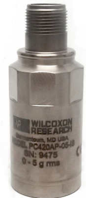
Table 1: PC420Ax-yy-IS model selection guide