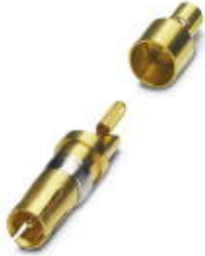
Coaxial contact, for D-SUB combination inserts, solder cup, socket, straight, for cable RG -178, gold-plated

Please be informed that the data shown in this PDF Document is generated from our Online Catalog. Please find the complete data in the user's documentation. Our General Terms of Use for Downloads are valid ( http://phoenixcontact.com/download )