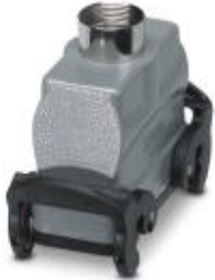
HEAVYCON B16 coupling housing, with double locking latch, height: 70.5 mm, with 1 x Pg21 gland, straight cable outlet

Please be informed that the data shown in this PDF Document is generated from our Online Catalog. Please find the complete data in the user's documentation. Our General Terms of Use for Downloads are valid ( http://phoenixcontact.com/download )