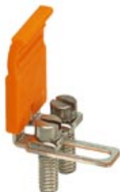
Switching jumper, Number of positions: 2, Color: silver

Please be informed that the data shown in this PDF Document is generated from our Online Catalog. Please find the complete data in the user's documentation. Our General Terms of Use for Downloads are valid ( http://download.phoenixcontact.com )