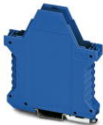
Component housing, length: 99 mm, Lower part, color: blue, width: 17.5 mm, height: 114.5 mm

Please be informed that the data shown in this PDF Document is generated from our Online Catalog. Please find the complete data in the user's documentation. Our General Terms of Use for Downloads are valid ( http://phoenixcontact.com/download )