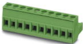
The figure shows a 10-pos. version of the product in green

Please be informed that the data shown in this PDF Document is generated from our Online Catalog. Please find the complete data in the user's documentation. Our General Terms of Use for Downloads are valid ( http://phoenixcontact.com/download )