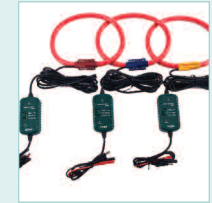
Model PQ34-30 3000A (24"/600mm) Flexible Current Clamp Probes for wrapping around busbars