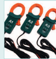
Model PQ34-12 1200A Current Clamp Probes with 2" (50mm) jaw size