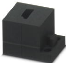
Small, slotted cable sleeves suitable for one AS-i cable, material: NBR, version: left

Please be informed that the data shown in this PDF Document is generated from our Online Catalog. Please find the complete data in the user's documentation. Our General Terms of Use for Downloads are valid ( http://phoenixcontact.com/download )