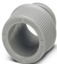
End sleeves as cable protection

Please be informed that the data shown in this PDF Document is generated from our Online Catalog. Please find the complete data in the user's documentation. Our General Terms of Use for Downloads are valid ( http://phoenixcontact.com/download )