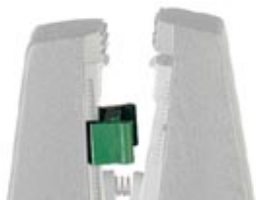
Wire stopper, for the stripping pliers QUICK WIREFOX 6

Please be informed that the data shown in this PDF Document is generated from our Online Catalog. Please find the complete data in the user's documentation. Our General Terms of Use for Downloads are valid ( http://download.phoenixcontact.com )