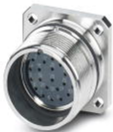
Device connector, front mounting

Please be informed that the data shown in this PDF Document is generated from our Online Catalog. Please find the complete data in the user's documentation. Our General Terms of Use for Downloads are valid ( http://phoenixcontact.com/download )