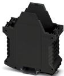
Component housing, length: 99 mm, Lower part, color: black, width: 45 mm, height: 114.5 mm

Please be informed that the data shown in this PDF Document is generated from our Online Catalog. Please find the complete data in the user's documentation. Our General Terms of Use for Downloads are valid ( http://phoenixcontact.com/download )