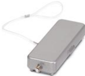
HEAVYCON protective cover, type B16, for supporting base element with single locking latch, with retaining cord, IP65, ALU

Please be informed that the data shown in this PDF Document is generated from our Online Catalog. Please find the complete data in the user's documentation. Our General Terms of Use for Downloads are valid ( http://download.phoenixcontact.com )