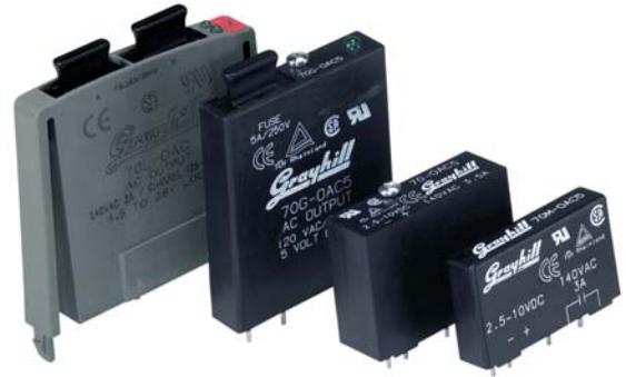
70L-OAC 70G-OAC 70-OAC 70M-OAC