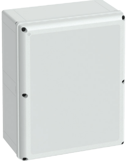
Cat No. 700-745 GEOS-L 4050-22-o with grey cover