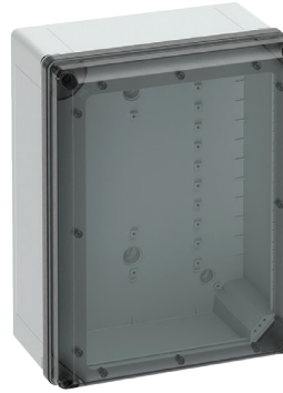
Cat No. 701-745 GEOS-L 4050-22-to with transparent cover