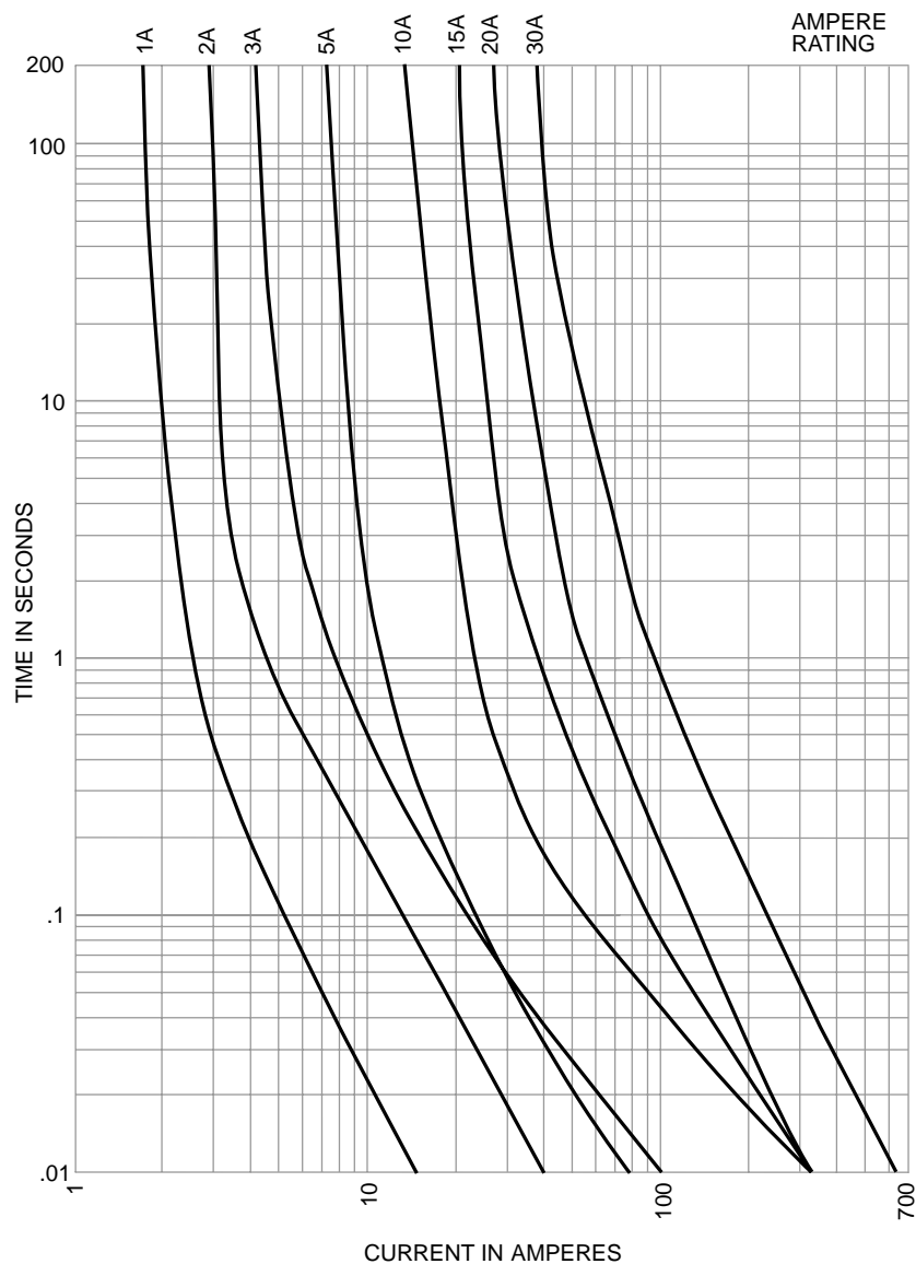
Time-Current Characteristic Curves—Average Melt (Full Size Curves Available)

The only controlled copy of this Data Sheet is the electronic read-only version located on the Bussmann Network Drive. All other copies of this Data Sheet are by definition uncontrolled. This bulletin is intended to clearly present comprehensive product data and provide technical information that will help the end user with design applications. Bussmann reserves the right, without notice, to change design or construction of any products and to discontinue or limit distribution of any products. Bussmann also reserves the right to change or update, without notice, any technical information contained in this bulletin. Once a product has been selected, it should be tested by the user in all possible applications.