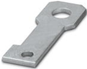
Plate for fixing the FLT-ISG-100-EX isolating spark gap to a flange, drill hole diameter of 18 mm.

Please be informed that the data shown in this PDF Document is generated from our Online Catalog. Please find the complete data in the user's documentation. Our General Terms of Use for Downloads are valid ( http://phoenixcontact.com/download )