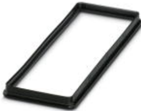
Profile gasket for sleeve housing type B24.....EEE

Please be informed that the data shown in this PDF Document is generated from our Online Catalog. Please find the complete data in the user's documentation. Our General Terms of Use for Downloads are valid ( http://phoenixcontact.com/download )