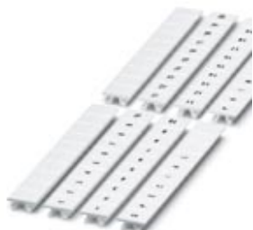
Zack marker strip, 10-section, horizontally labeled with the consecutive numbers: 211 ... 220, white, width: 8 mm

Please be informed that the data shown in this PDF Document is generated from our Online Catalog. Please find the complete data in the user's documentation. Our General Terms of Use for Downloads are valid ( http://phoenixcontact.com/download )