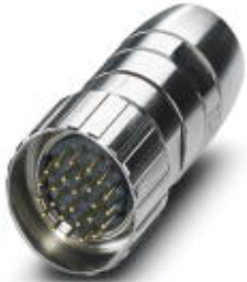
Cable connector, straight, Screw locking, M27, number of positions: 26, type of contact: Pin, Solder connection

Please be informed that the data shown in this PDF Document is generated from our Online Catalog. Please find the complete data in the user's documentation. Our General Terms of Use for Downloads are valid ( http://phoenixcontact.com/download )